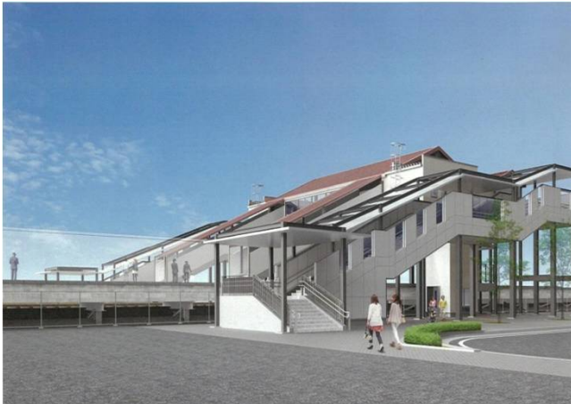
JR西岡崎駅完成パース図（北口）