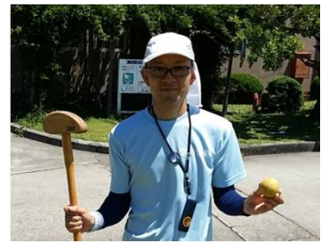
6/6東レOB会グランドゴルフ