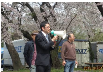
4/4日清紡美合工機支部花見